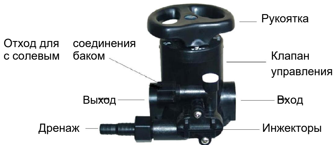
Таблица № 1.